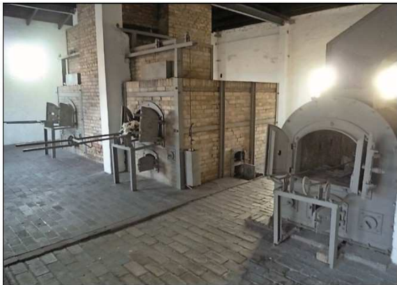
Das Krematorium hatte drei Verbrennungsöfen.

Koblenz. Über 70 Jahre ist es her, dass der Zweite Weltkrieg zu Ende ging und mit ihm eine Zeit unvorstellbaren Leids. Nur noch wenige Menschen, die diese Zeit hautnah miterlebt haben, können davon berichten. Wenn diese Menschen berichten, dann hört man vor allem eins heraus: „Das darf nie wieder passieren“. Diese Menschen wissen, warum. Aber wie sieht es bei den nachfolgenden Generationen aus, die in Frieden aufgewachsen sind? Krieg kennt man aus den Nachrichten. Krieg passiert überall, nur nicht hier. Gerne schiebt man solche Bilder von sich weg. Es ist schwer vorstellbar für jemanden, der in Frieden aufgewachsen ist, dass sich solche Zeiten wiederholen könnten. Doch Menschen machen Fehler und deshalb ist es umso wichtiger, immer wieder an vergangene Tage zu erinnern und daraus zu lernen. Dieser verantwortungsvollen Aufga-