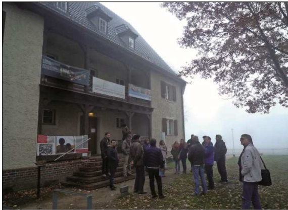
Joachim Hennig und viele andere Interessierte nahmen an der Studienfahrt in das Frauenkonzentrationslager Ravensbrück teil. Hier steht die Gruppe vor dem ehemaligen Kommandaturgebäude.