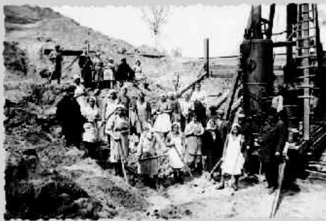
Weibliche KZ-Häftlinge im Steinbruch des KZ Krakau-Plaszow, 1944