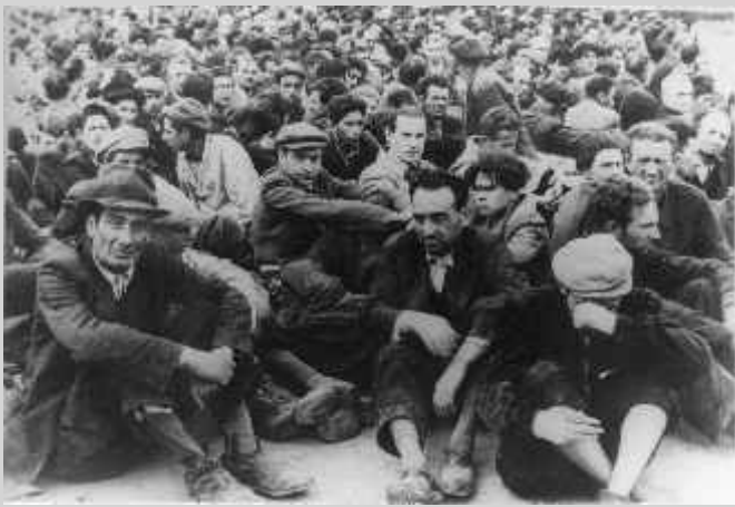
Männer vor ihrer Deportation zur Zwangsarbeit, Ort und Datum unbekannt (IPN)