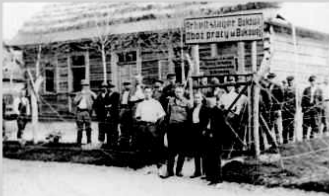
Arbeitslager für Polen und Juden in Bukowa bei Biłgoraj, 1941