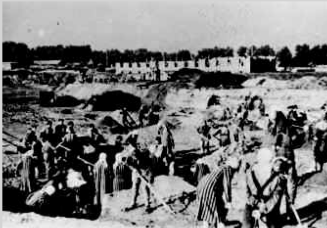
Erdarbeiten in der Nähe von Blachownia / Blechstadt bei Częstochowa / Tschenstochau, 1942

Deutsche Besatzung in Polen Organisation der Zwangsarbeit Sklavenarbeit - Konzentrationslager - Vernichtung der Juden - Polen-Jugendverwahrlager - Straflager und Zuchthäuser Einsatz polnischer Zwangsarbeiter - Frauen - Minderjährige Zwangsarbeiter - Kriegsgefangene Aussiedlungen Germanisierung Kinder von Zwangsarbeiterinnen Heimkehr oder Emigration? Helden Der Weg zur Aussöhnung